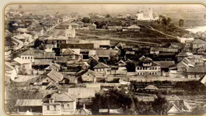
Общий вид Яранска в начале 20 века

собие каждому беженцу давать за месяц вперед, обеспечить их дровами, одеждой, беженцев, что имели детей, поселять в деревнях, вблизи которых имеются школы, и т.д. Беженцы, расквартированные в деревнях, в основном попадали в большие крестьянские семьи, имевшие большие избы. Скученность, антисанитария, наличие вшей, вызывали эпидемии сцепного тифа, дизентерии и других инфекционных болезней. Увеличилась смертность среди местного населения, беженцев, особенно высокой она была в среде военнопленных.