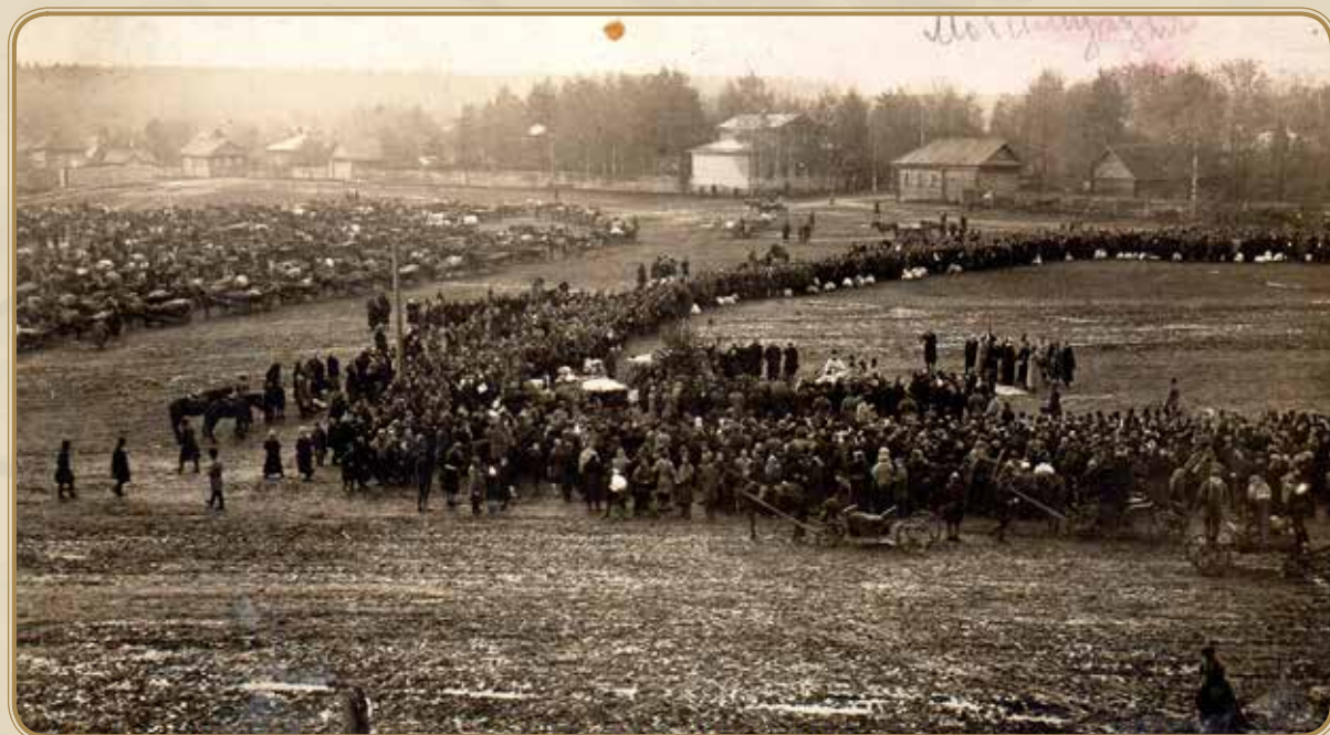
Мобилизация 1914 год

Информация подготовлена хранителем музейных ценностей МБУК «Яранский краеведческий музей» Еленой Васильевной Толстогузовой