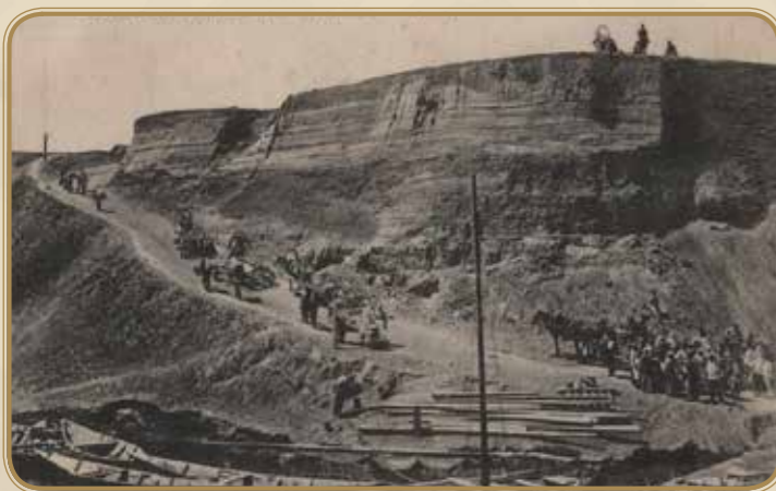
Берег у горы