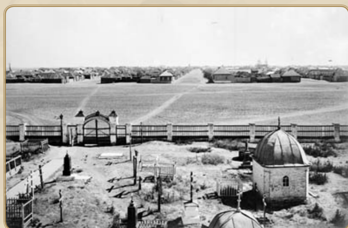
Вид на Черный Яр