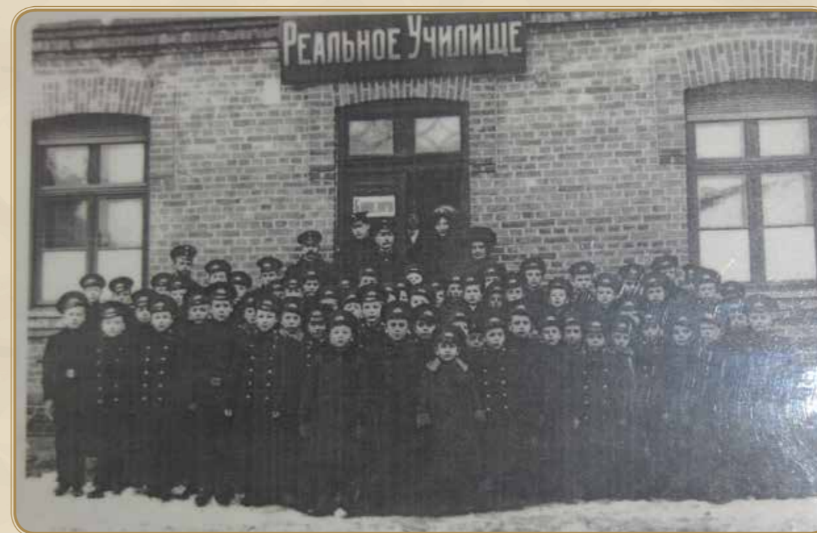
Одни из первых учеников у входа в училище