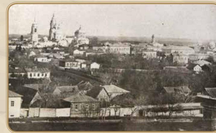
Улица Никольская (Революционная)