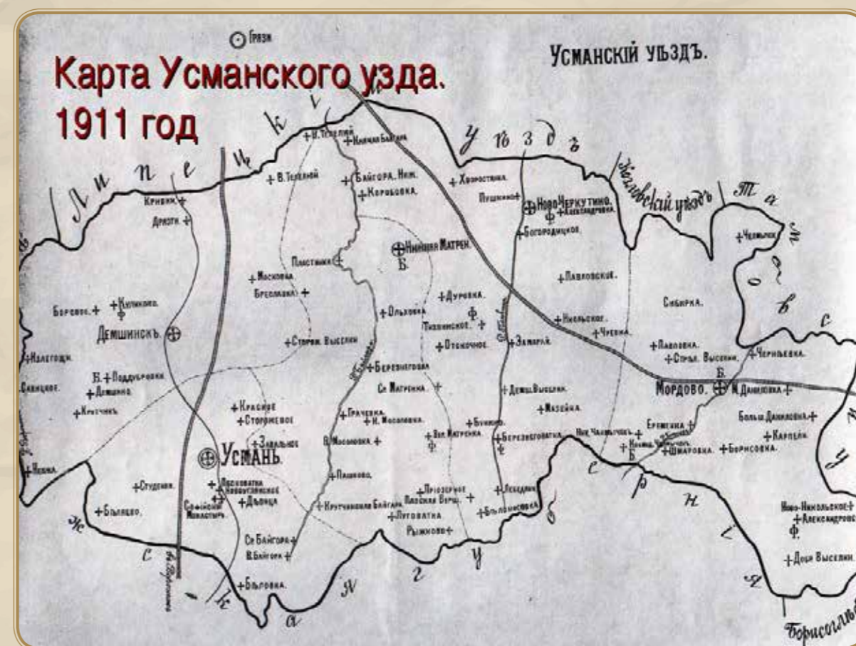
Карта Усманского уезда