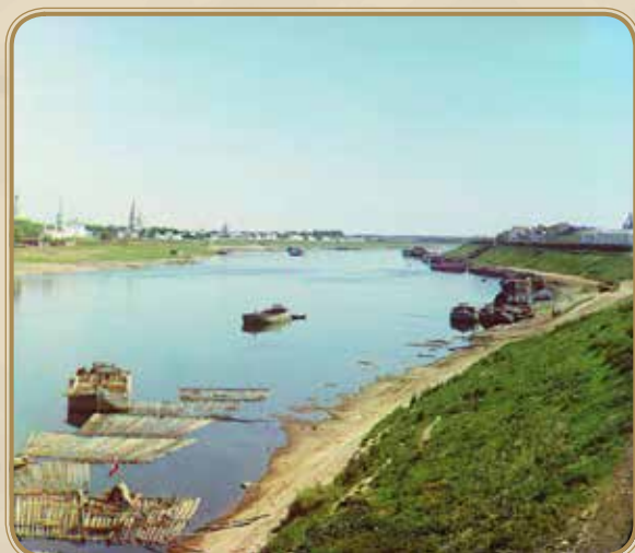
Вид на реку и свято-екатерининский монастырь