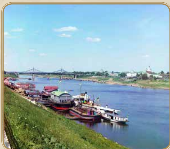
Вид на Старый мост