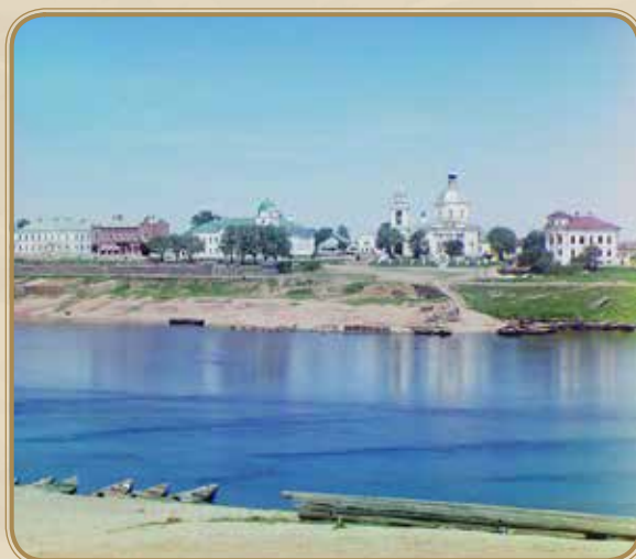
Вид на Храм трех исповедников