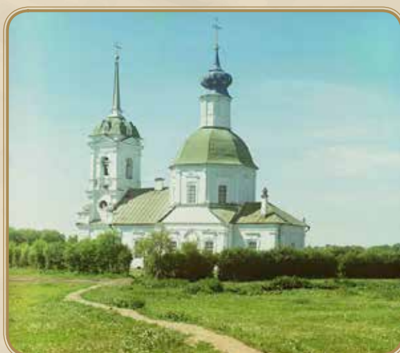
Церковь николая чудотворца в капустниках