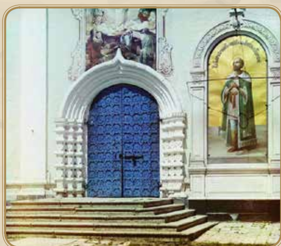
Врата спасо-преображенского собора