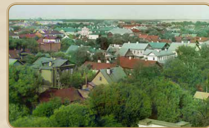
Вид на Тверь

1917 год начался январскими волнениями на заводах и фабриках Твери, Вышнего Волочка, Ржева. Обстановка была неустойчивой и тревожной, повсюду в обществе ругали правительство и царя. Тем временем революционные организации начали агитацию на фабриках и среди солдат Тверского гарнизона. В Желтиковых казармах за городом и в самой Твери размещались запасные части. Большинство солдат были призваны из деревни. Они месяцами ожидали отправки в действующую армию. Казарменная жизнь и плохое снабжение вызывали раздражение и недовольство среди новобранцев, не желавших идти на фронт. Появление агитаторов подстегнуло это недовольство. 3 марта в Твери образовался Совет рабочих депутатов, в котором преобладали меньшевики.