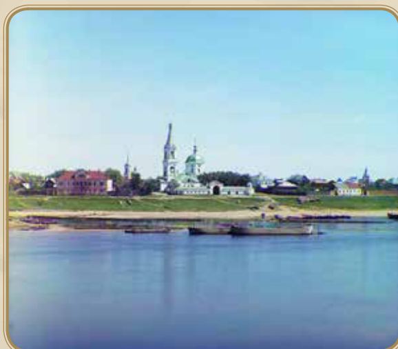
Вид на свято-екатерининский монастырь