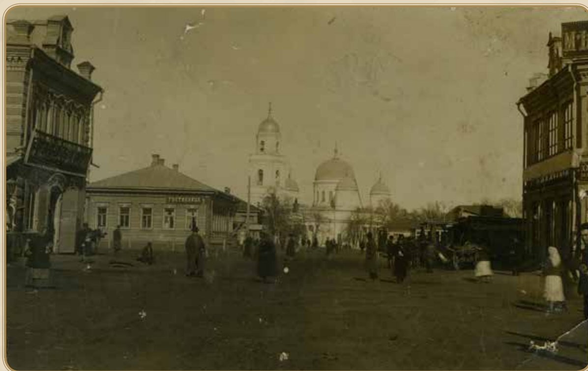
Стерлитамак, ул. соборная, вид на Казанский собор

в городе имелось несколько учебных заведений: женская гимназия, высшее начальное и мужское реальное училища, старообрядческая школа, медресе, мектебе, несколько начальных школ, русский и башкирский драмкружки, синематограф «Мираж», музей, две типографии, купеческий клуб, библиотеки, а также земская больница с глазной лечебницей; успешно работали органы земского и городского управления.