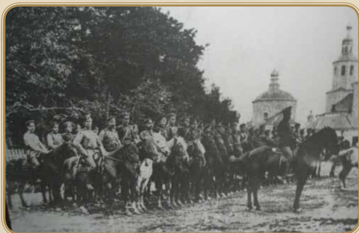
Конная стража в г. Поречье снимок нач. XX в.