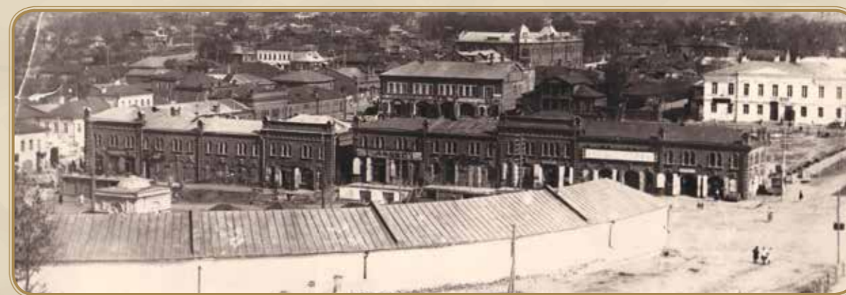
Общий вид Подольска