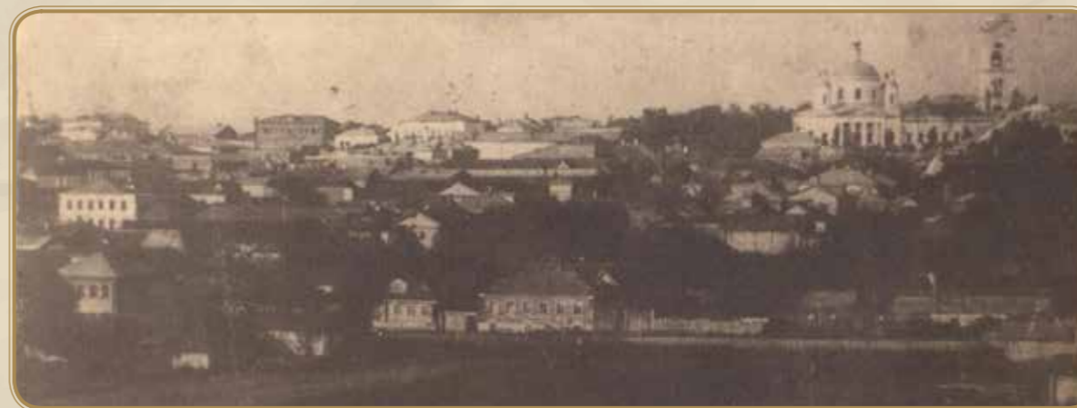
Вид на Восточную часть Подольска