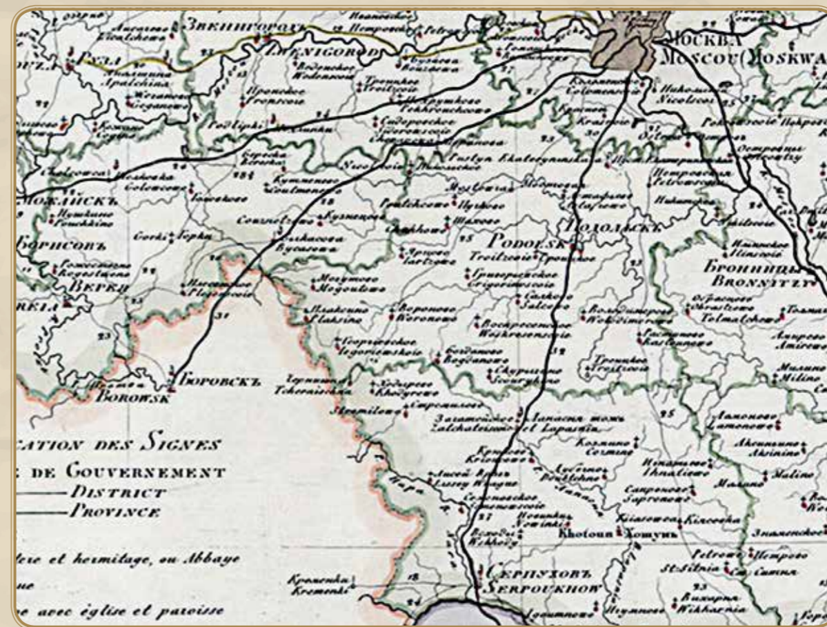
Карта Подольского уезда копия