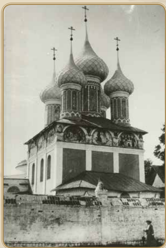
Вид на Храм