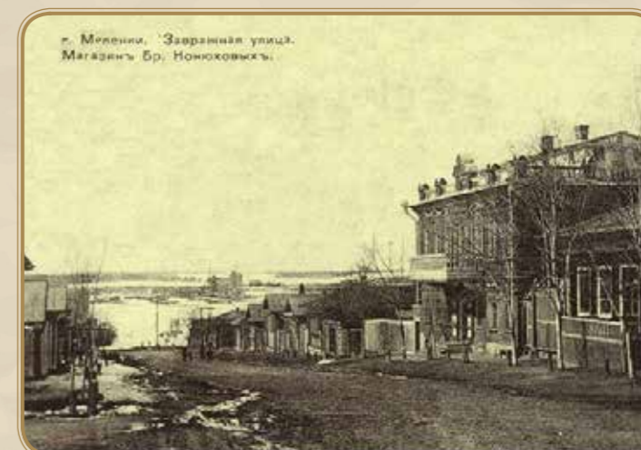
двух этажное здание магазин купца Конохова 1910г