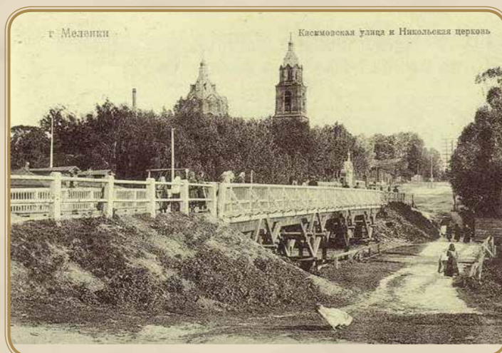
Комсомольская улица бывшая Касимовская фото 1910г