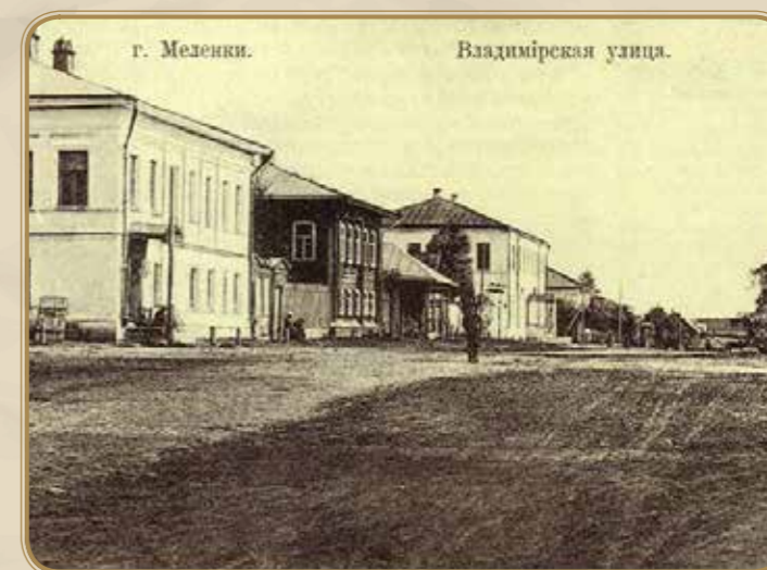
Сейчас ул. 1 Мая, фото 1910 г