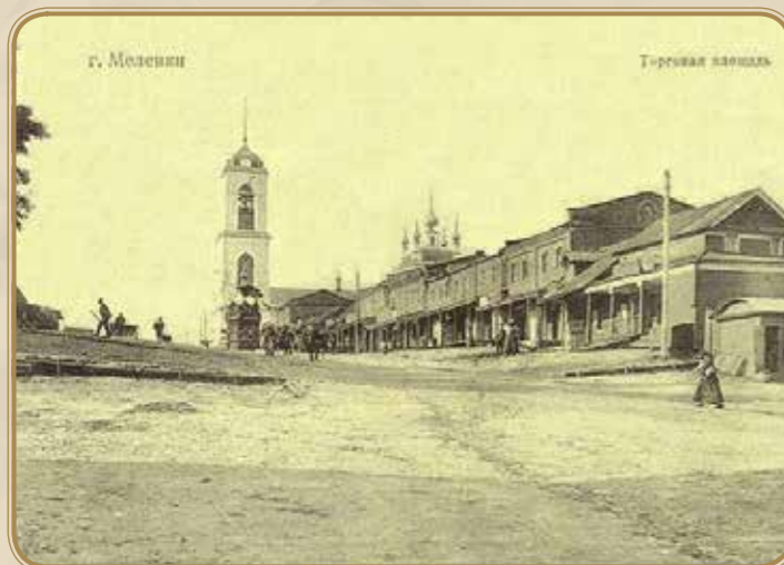
Торговая площадь, фотот 1910г.