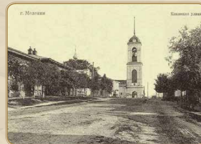
Казанская улица (Красноармейская) фото 1910г