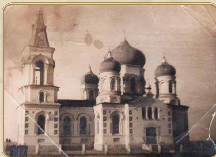
Храм Успения Пресвятой Богородицы

пожертвования и взносы всего населения уезда. Двухэтажное здание гимназии было построено согласно «школьному проекту» в два строительных периода. 1 сентября 1912 г. на нижнем этаже начали занятия подготовительный и 3 основных класса гимназии с общим числом учащихся 86 человек. Заведующим учреждением по назначению попечителя Кавказского учебного округа был назначен Георгий Яковлевич Белоусов. Этот человек сыграл огромную роль в общественной жизни нашего села и всего уезда.