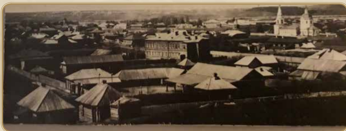
Малмыж в начале XX в.