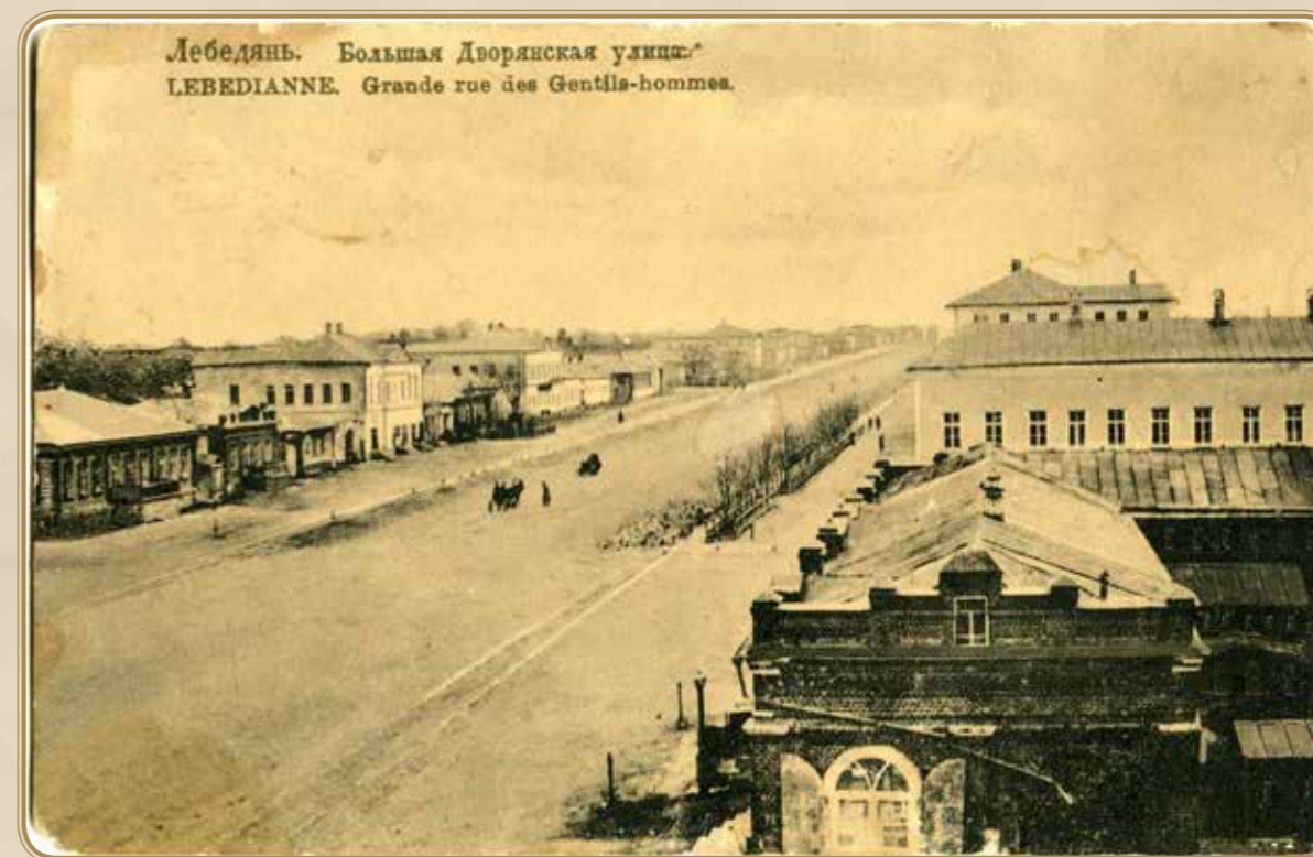
Большая Дворянская улица