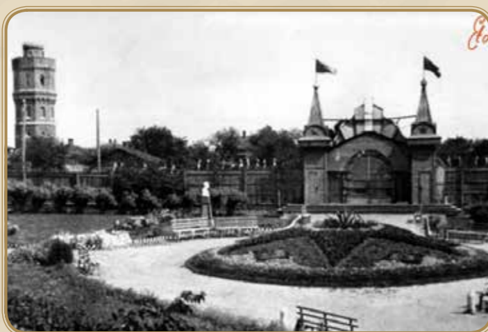
Вид на площадь