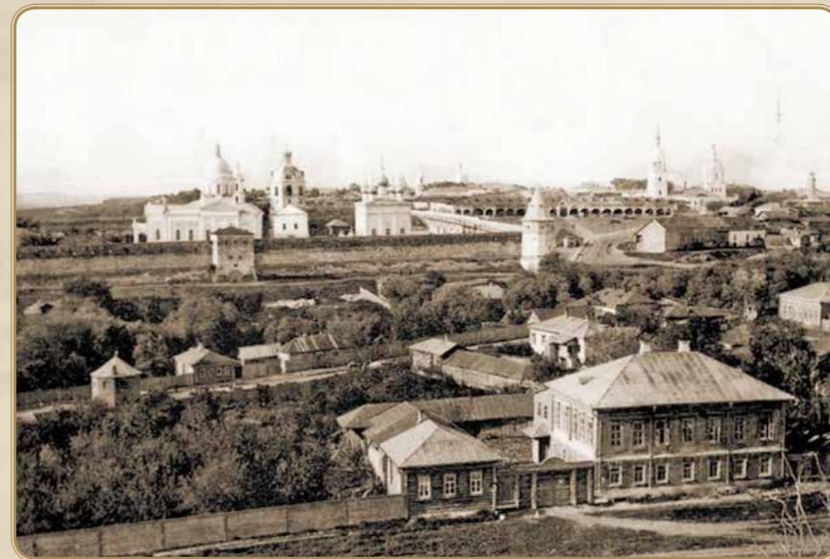
Общий вид Кремля

«Богатые обязаны творить благо» — этому девизу на протяжении тринадцати поколений следовали зарайские купцы Бахрушины, крупные предприниматели и благотворители, меценаты и коллекционеры; на их средства возводились образовательные