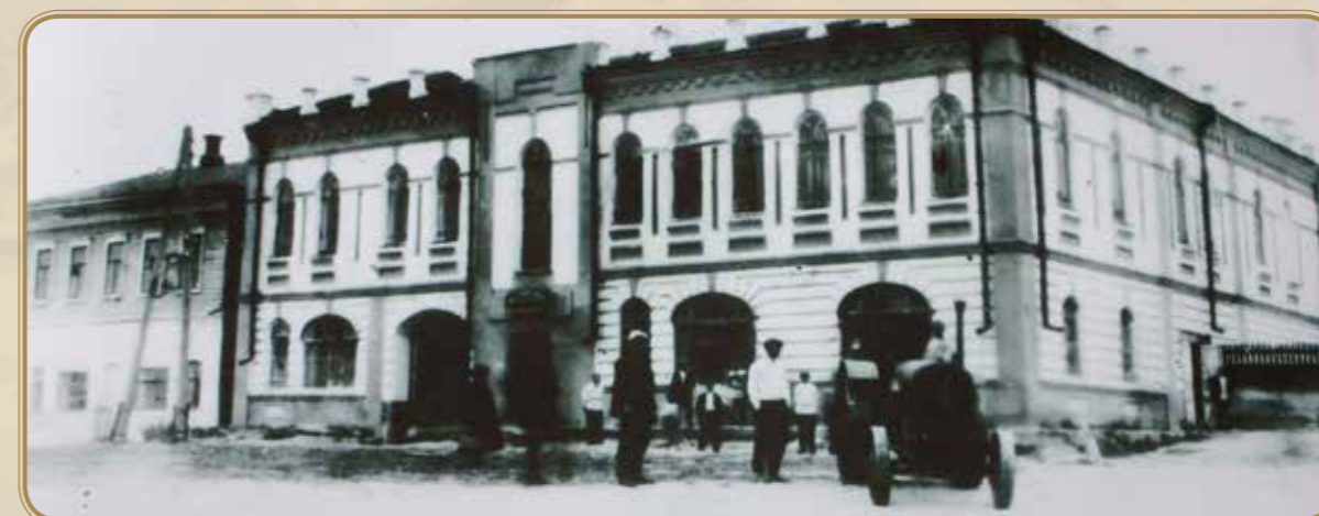
Дом купца Исаенкова