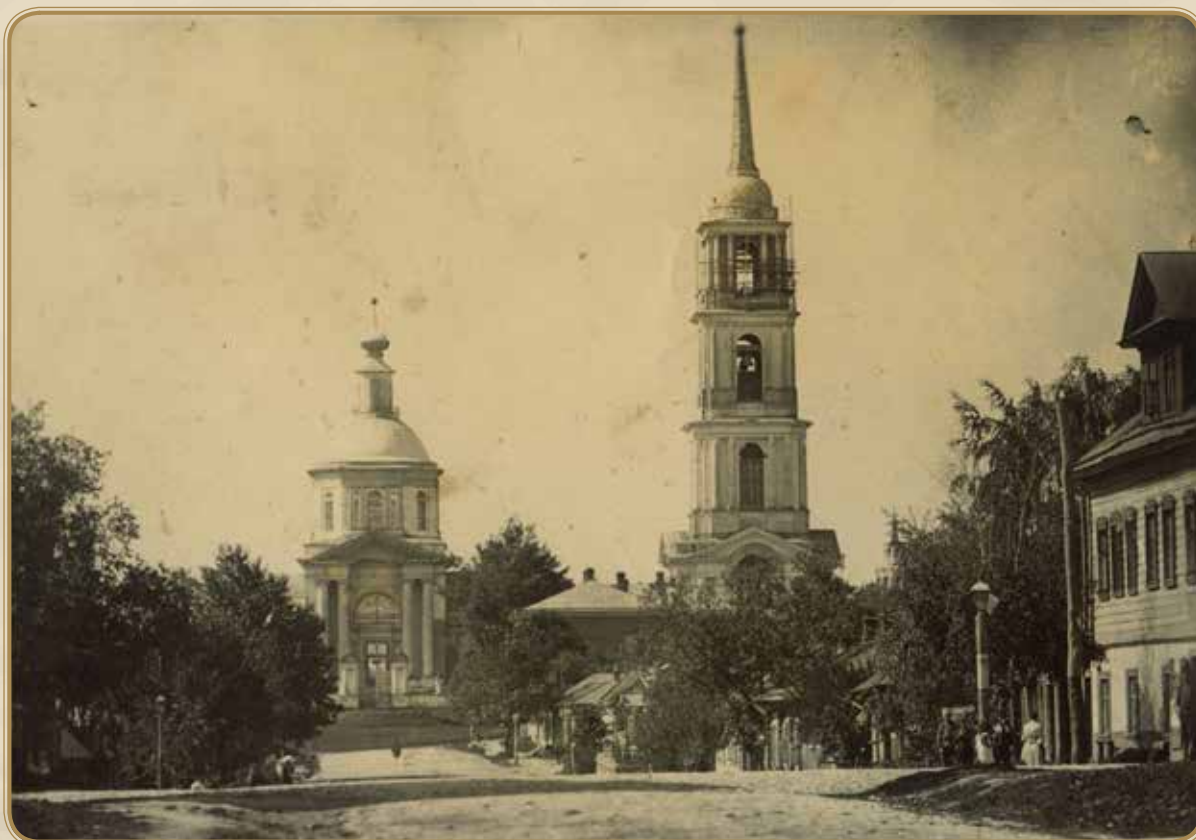
Рязанская улица-прилал краевед Д.Махель