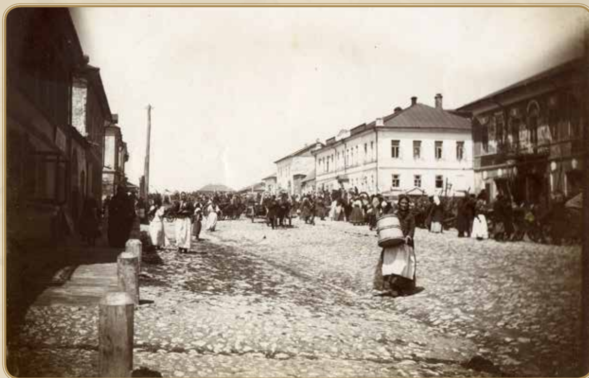
Базарный день- прилал краевед Д.Махель