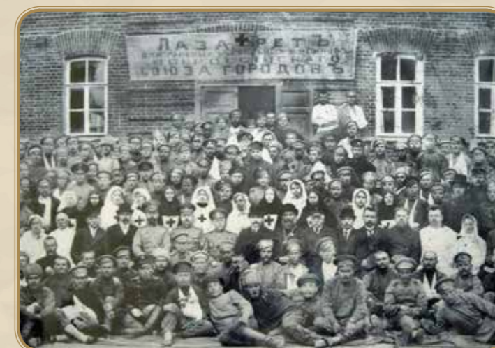
Лазарет в Веневском духовном училище, 1917