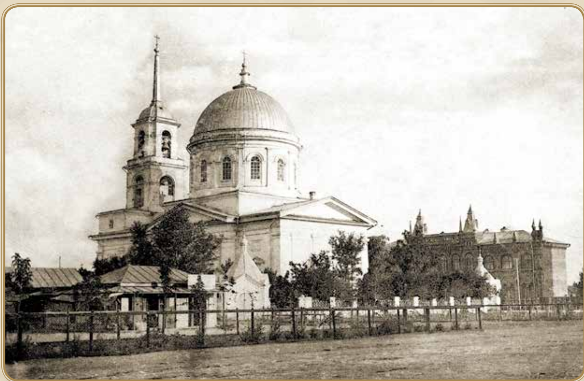
соборная площадь с ул. Оренбур