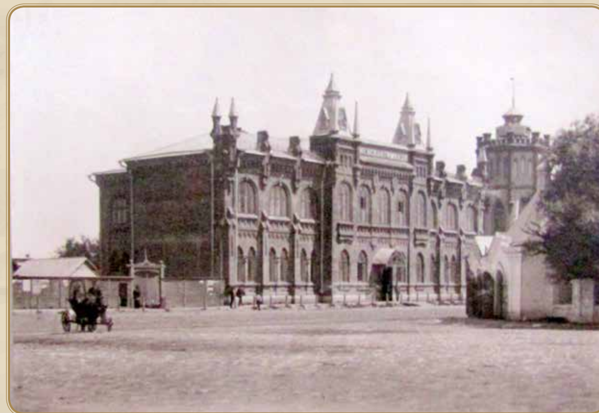
женская гимназия. ул. Самарская