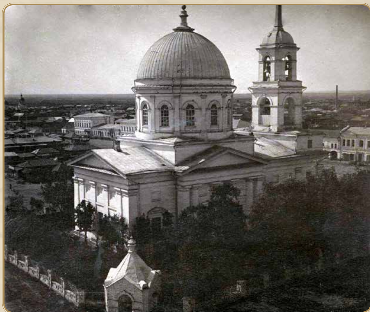
Вид на Троицкий собор со стороны водонапорной башни