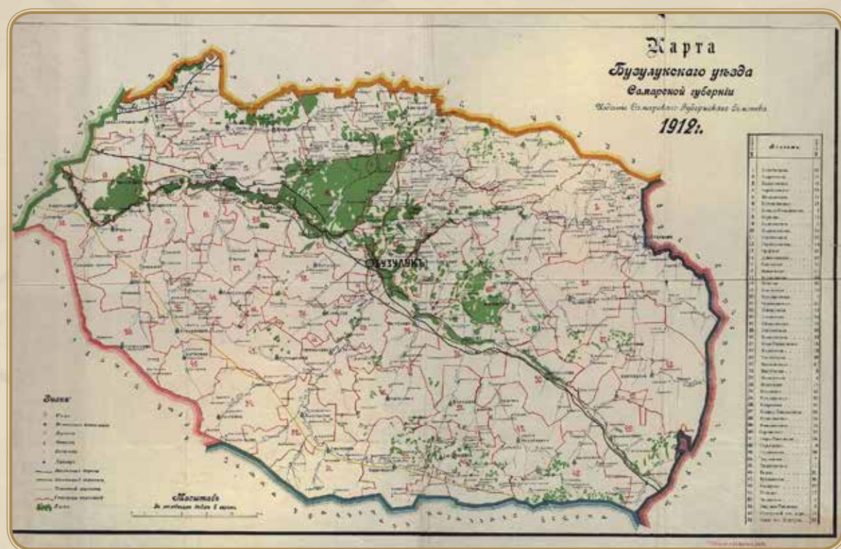
Карта Бузулукского уезда 1912 г