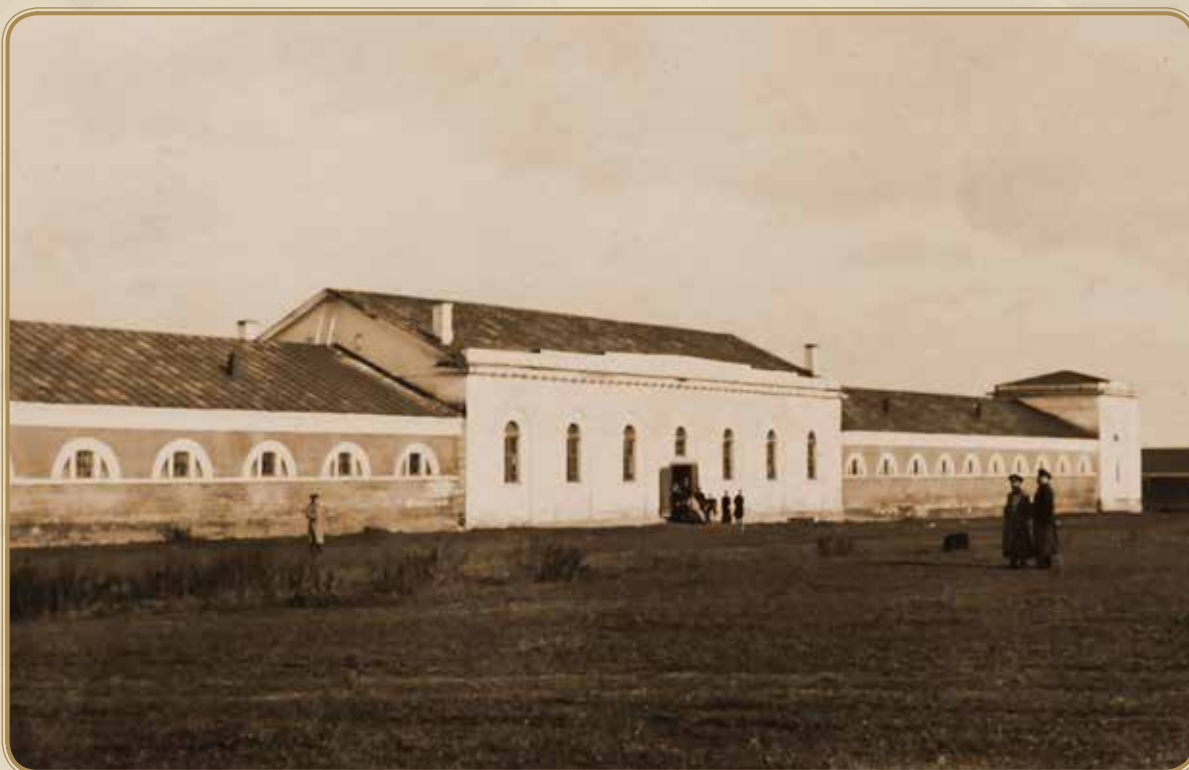
Бронницы. Казармы конного полка