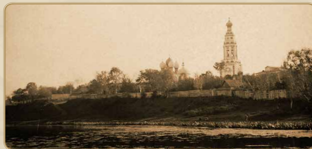
Бронницы. Вид со стороны Бельского озера

кого уездного земского собрания от 30 января 1915 г.: “Разрешить израсходовать из средств, отпущенных Уездному Комитету по оказанию помощи больным и раненым воинам, 1000 рублей на приобретение рентгеновского кабинета” .