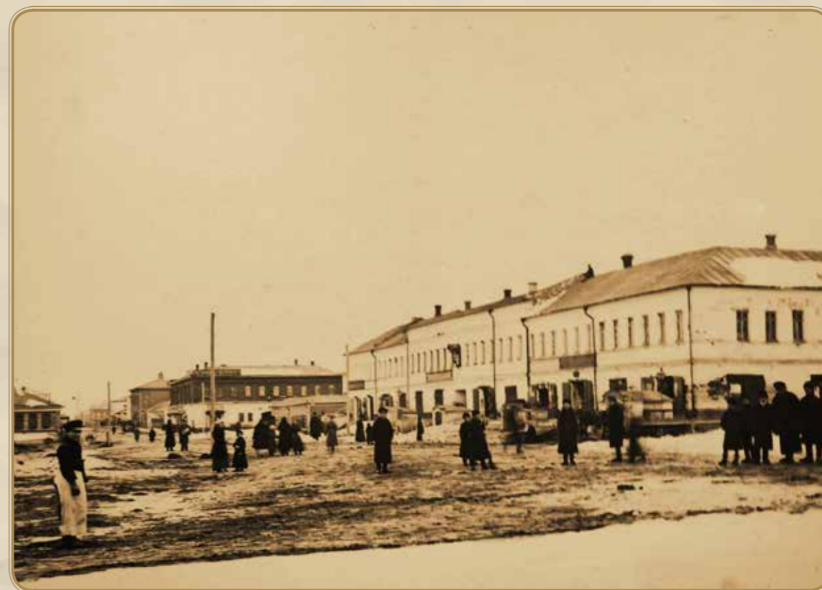
Бронницы. Дворянская улица. Гостиный двор

Информация подготовлена научным сотрудником МУК «Музей истории города Бронницы» Сливка Ириной Александровной