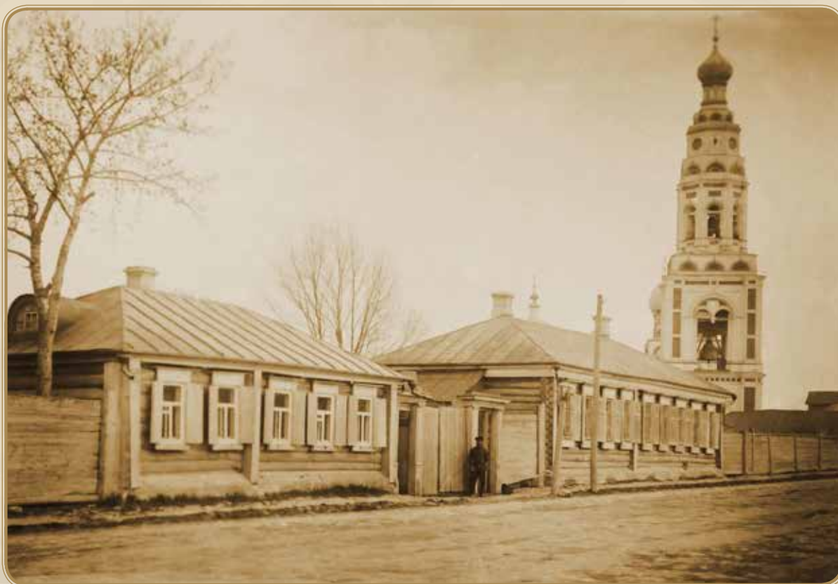
Высочайший манифест о вступлении России в мировую войну