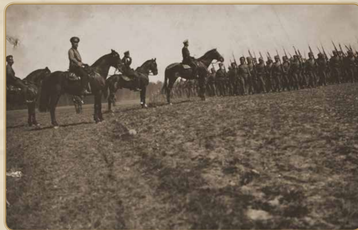
210-й Брон.пех.полк на марше.