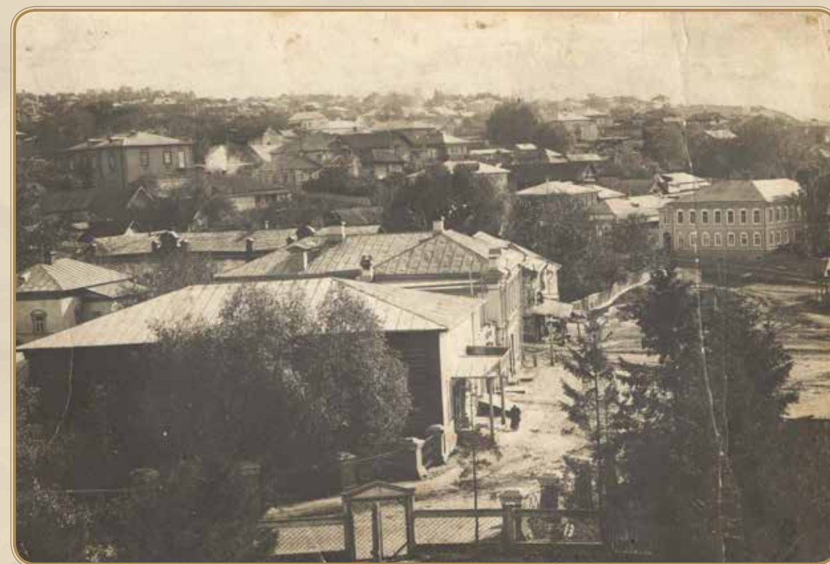
Вид с Галкиной горы