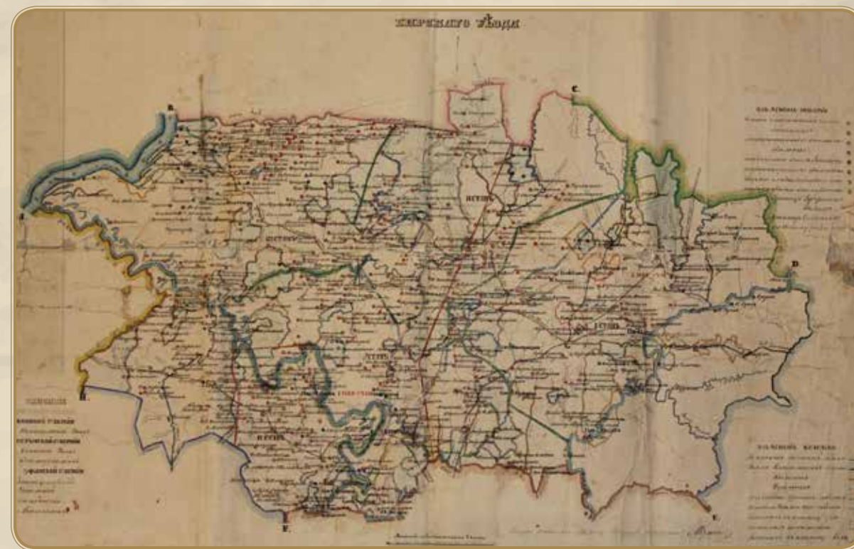
Карта Бирского уезда

Во время Крестьянской войны 1773-1775 гг. под предводительством Е. И. Пугачева в Бирске располагались отряды правительственных войск под командованием Отто фон Дуве. 4 июня 1774 г. город был сожжен отрядами повстанцев. За ненадобностью крепость решено было не восстанавливать. Однако до 1797 г. Бирск официально все еще считался крепостью.