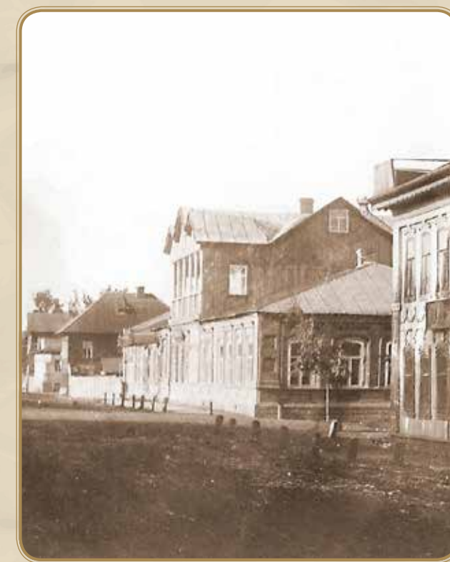
Дом купца Таганова