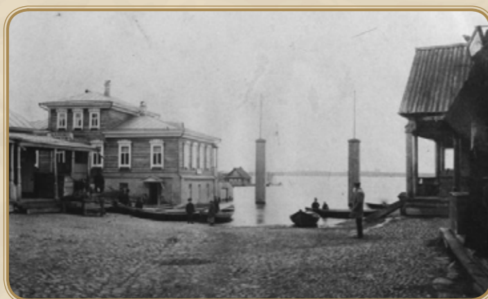
Вид на реку